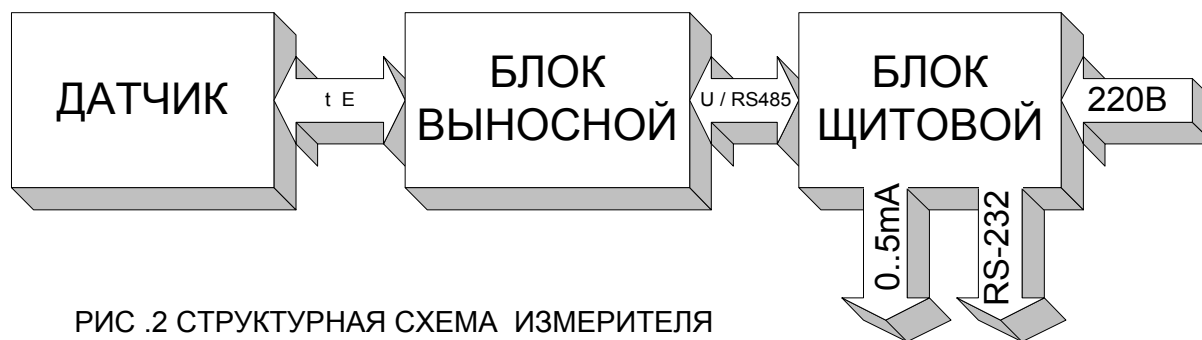
РИС .2 СТРУКТУРНАЯ СХЕМА ИЗМЕРИТЕЛЯ ВЛАЖНОСТИ НЕФТЕПРОДУКТОВ

4.2.2. Прибор состоит из блока электронного щитового, блока электронного выносного и преобразователя диэлькометрического (датчика влажности).